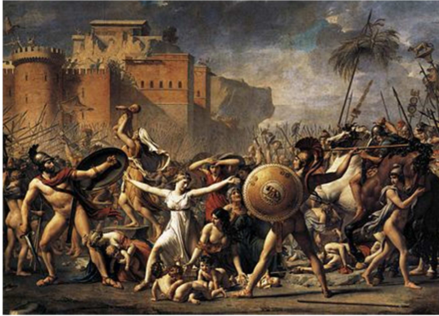
J. L. David – Únos Sabineek