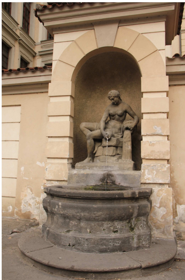
Václav Prachner - alegorie Vltavy