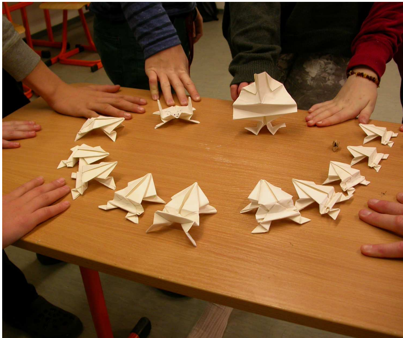
Krásné papírové žabičky

těl jsem vybrat něco, co ještě dy nezkusili a dodržet tu aktickou pyramidu od kladu až po praktickou oušku