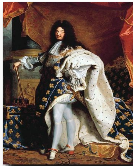
Ludvík XIV. 1643-1715